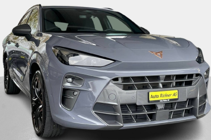
Auto Richner AG